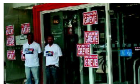
Imagens dos principais acontecimentos no ano que termina. Página 2 e 3